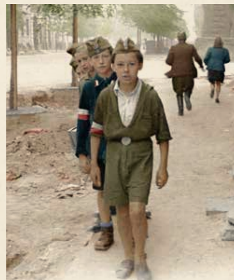
Grupa chłopców na ul. Sienkiewicza.

Służył w zgrupowaniu „Żyrafa”, pluton 227: „Siłą rzeczy trafiłem do oddziału «Szczerów kanałowych». Przeżycia były ogromne. (...) to był potworny stres. Jak się szło z grupą w kanał, to było raźniej, bo ktoś był przed tobą, ktoś był za tobą. Była grupa, był zespół na dobre i na złe. Natomiast chodzenie samemu po kanałach, czy pozostawianie w kanałach na czujkach, to już była sprawa strasznego przeżycia psychicznego”.