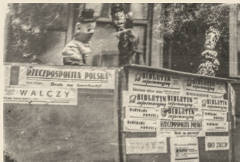
Teatrzyk kukielkowy dla dzieci Kukielki pod Barykadą.