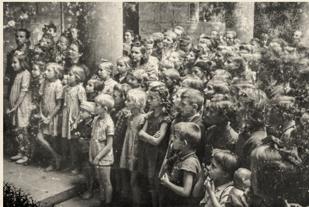
Dzieci oglądające spektakl.

Po zajęciu przez Niemców Starego Miasta zespół teatralny musiał uciekać kanałami na Śródmieście.