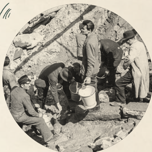
Kolejka po wodę ze zniszczonego wodociągu.