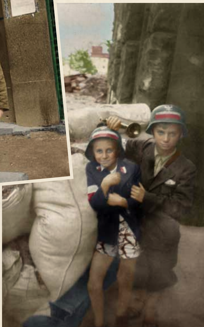
Dwoje dzieci przy workach z piaskiem w bramie gnałcu Zarządu Towarzystwa Zakładów Gazowych przy ul. Kredytowej 3.